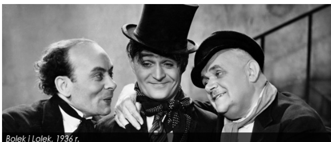
Bolek i Lolek, 1936 r.

Zmarł 20 sierpnia 1975 roku w Górze Kalwarii.